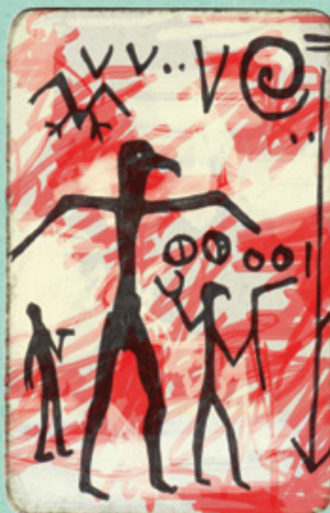
Defesa - A.R. PENCK