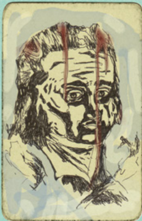
Caminhos da sabedoria do mundo - A Batalha de Hermann - ANSELM KIEFER

Nestas cartas poderás encontrar obras que estão em exposição e outras que embora não estejam presentes, pertencem aos artistas e movimentos artísticos aqui representados.