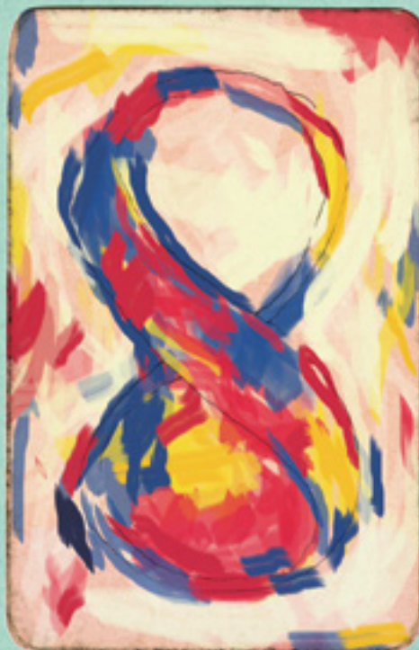
Número 8 - JASPER JOHNS