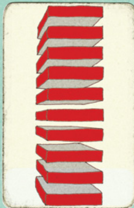
Sem Título - DONALD JUDD